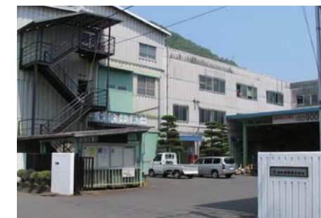
共和精機株式会社

1952年に設立された共和精機は、リョービのダイカスト製品の加工工場として出発。その後、世界的にも知られるリョービのオフセット印刷機の立ち上げに協力し、現在では、オフセット印刷機の製造は共和精機の主力事業となっています。同社の担当製品は、中型の78シリーズ、小型の52シリーズ(単色、二色、四色以上)と、それらにオプション機能を付加した製品です。リョービが設計、生産計画、販売を行い、共和精機は資材調達から製造、組立まで一貫した体制で事業を支えており、その高い技術と品質は世界市場における競争力の源泉となっています。